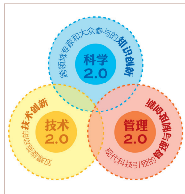
图1 面向知识社会的创新2.0构成简图

识社会环境下的创新民主化》 [1] 一文中认为，进入21世纪，在信息通信技术融合与发展的推动下，知识社会的形成及其对创新的影响被进一步认识，使创新进入了第四个长波。随着信息技术的融合与发展，知识网络的泛在性日益突出，无处不在的网络推动了知识的传递与共享，成为知识社会形成和发展的重要基础。知识社会日益呈现出复杂多变的流体特性，传统的社会组织及其活动边界正在“融化”。以技术发展为导向、科研人员为主体、实验室为载体的科技创新活动面临着挑战，以用户为中心、以社会实践为舞台、面向知识社会的新一代创新（即创新2.0模式）正在逐步显现其生命力和潜在价值。创新2.0的研究与实践逐渐得到各界重视。以移动技术为代表的普适计算、泛在网络的发展推动了以物联网、云计算、大数据为代表的新一代信息技术发展，进一步推动了创新2.0的涌现和发展。